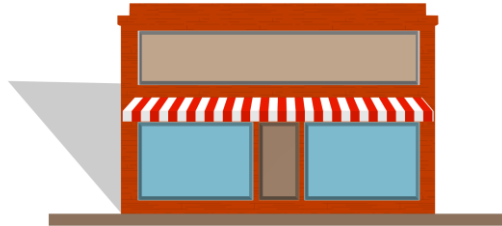
La tienda/el escaparate Il negozio/la vetrina