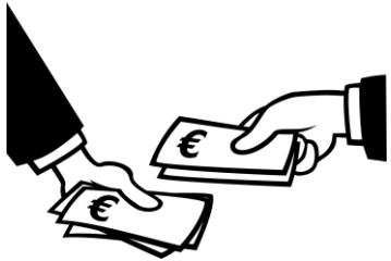
El vuelto Il resto