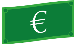
El billete La banconota