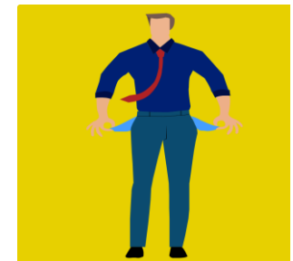
Estar sin blanca Essere al verde