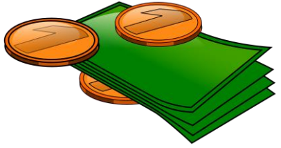
El dinero I soldi