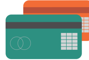
La tarjeta de crédito La carta di credito