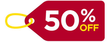
El descuento/las rebajas Lo sconto/i saldi