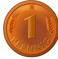
La moneda/el céntimo La moneta/il centesimo