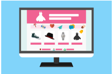
La compra online L'acquisto online