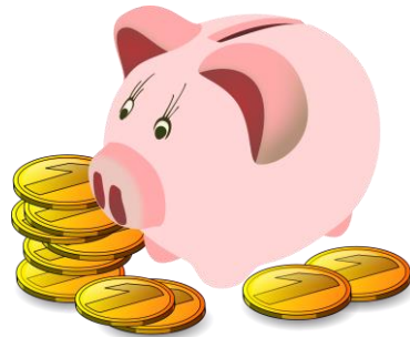
Ahorrar/el ahorro Risparmiare/il risparmio